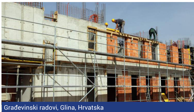
Građevinski radovi, Glina, Hrvatska

U Crnoj Gori napreduju građevinski projekti koji se finansiraju u okviru RSP programa u tri glavna grada - Nikšiću, Koniku i Pljevljima. U Nikšiću je u maju završena izgradnja dvije stambene zgrade za smještaj 62 ugrožene porodice, a stanovi su na korištenje predati u junu. Završetak izgradnje 120 stanova u kampu Konik započete u martu 2016. godine očekuje se u drugoj polovini 2017. godine, a početak radova na gradilištu u Pljevljima službeno je obilježen krajem juna.