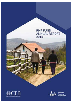
Godišnji izvještaj RSP fonda za 2015. godinu

Tokom maja i juna 2016. godine objavljeno je nekoliko publikacija: