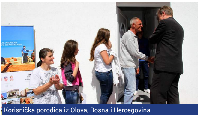
Korisnička porodica iz Olova, Bosna i Hercegovina

Četiri partnerske zemlje će tokom ljeta i jeseni nastaviti s građevinskim radovima za zbrinjavanje preko 1.800 odabranih korisničkih porodica i mnogobrojnim raspisanim i/ili završenim tenderima. Tokom prvih pet mjeseci 2016. godine, dinamika sprovedbe RSP programa značajno je ubrzana, a tekuće aktivnosti namijenjene su osiguravanju domova za hiljade ugroženih osoba. Ovakvim tempom očekuje se da broj osiguranih stambenih jedinica ove godine bude trostruko veći u odnosu na 2015. godinu.