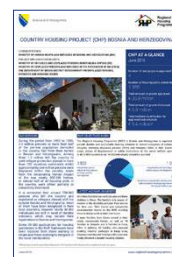
Bosna i Hercegovina