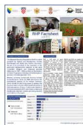
RSP info listovi za juni 2016. godine