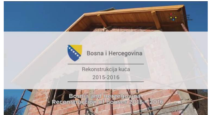
Bosna i Hercegovina: kratki film o rekonstrukciji kuća 2015 - 2016.