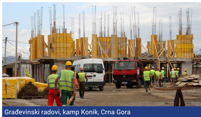
Građevinski radovi, kamp Konik, Crna Gora

Odabir korisnika za sve projekte u Bosni i Hercegovini napreduje dobro, a isti je slučaj i s isporukom paketa građevinskog materijala i rekonstrukcijom kuća. Već je osigurano dvadeset stambenih jedinica i očekuje se da se gotovo 1.000 korisnika useli u svoje nove domove do kraja 2016. godine. Na posljednjoj sjednici Upravnog odbora RSP održanoj u Sarajevu, RSP donatorima i drugim interesnim grupama organizovana je posjeta korisnicima u Novom Goraždu.