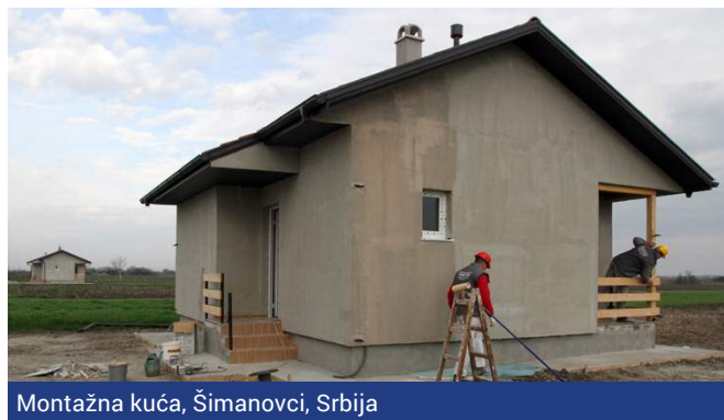
Montažna kuća, Šimanovci, Srbija

Nakon uspješnog završetka projekta u Korenici, u Hrvatskoj su sada aktivna još tri gradilišta i to u Glini (rekonstrukcija doma za 75 starijih osoba i osoba s invaliditetom), Kninu (izgradnja dvije stambene zgrade s 40 stanova) i Benkovcu (izgradnja stambene zgrade za 21 obitelj). Pored toga, Hrvatska je već kupila 58 stanova u okviru projekta kojim je planirana kupnja stanova za 101 korisničko domaćinstvo. Do sada je korisnicima u Hrvatskoj obezbijeđeno 87 stambenih jedinica, a do kraja godine očekuje se završetak još 50.